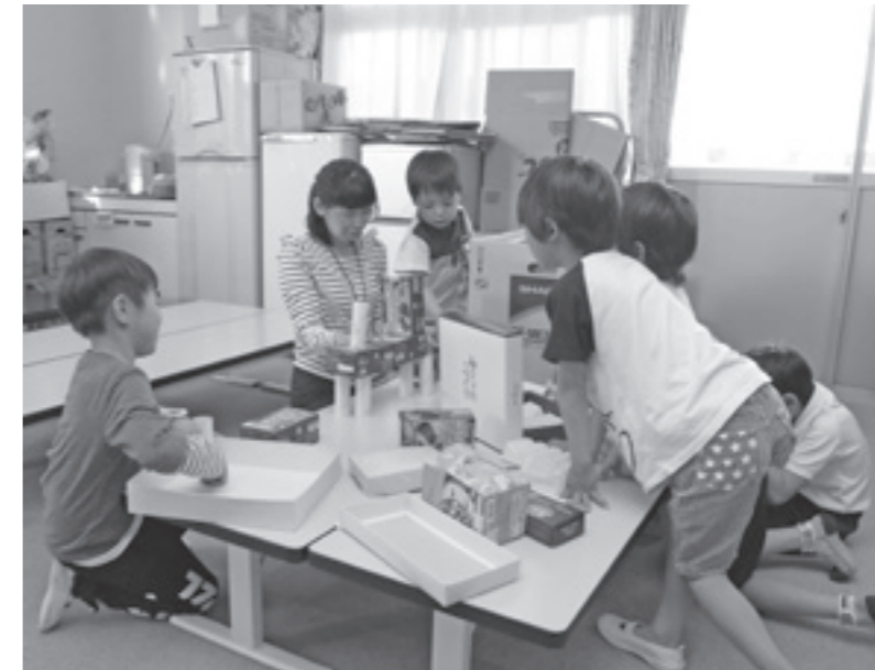
放課後児童クラブ