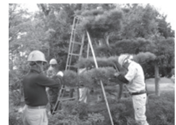
シルバー人材センター就労の様子