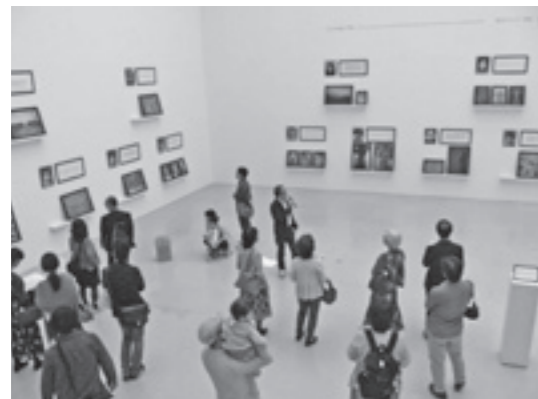
美術館の企画展会場風景