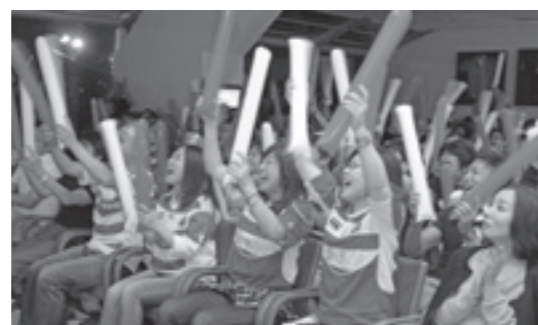
パブリックビューイングによるラグビーの応援