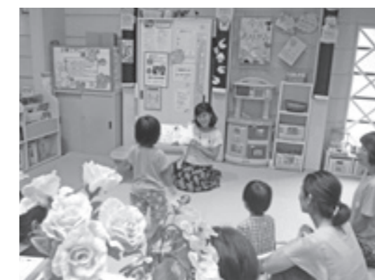
高齢者の活躍支援事業