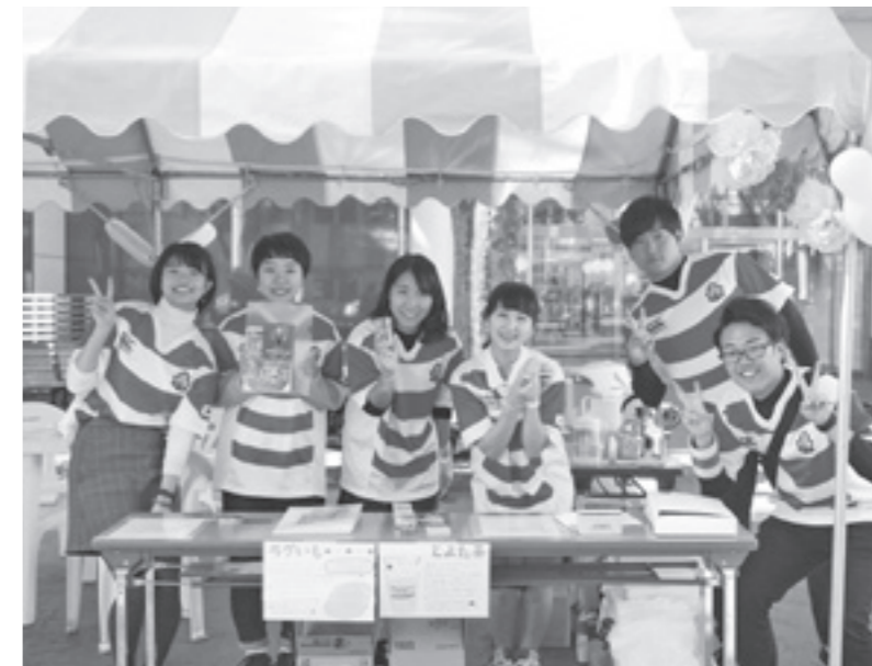
学生が提案し、取り組む活動