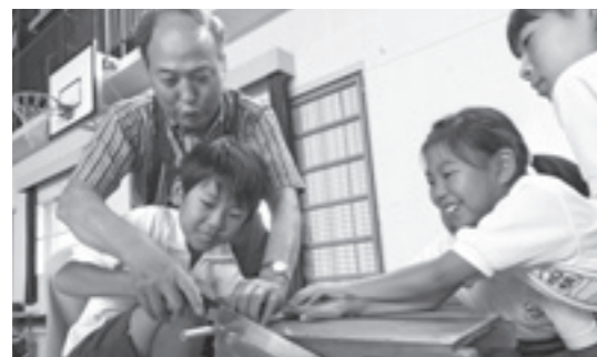
ものづくり教育プログラム