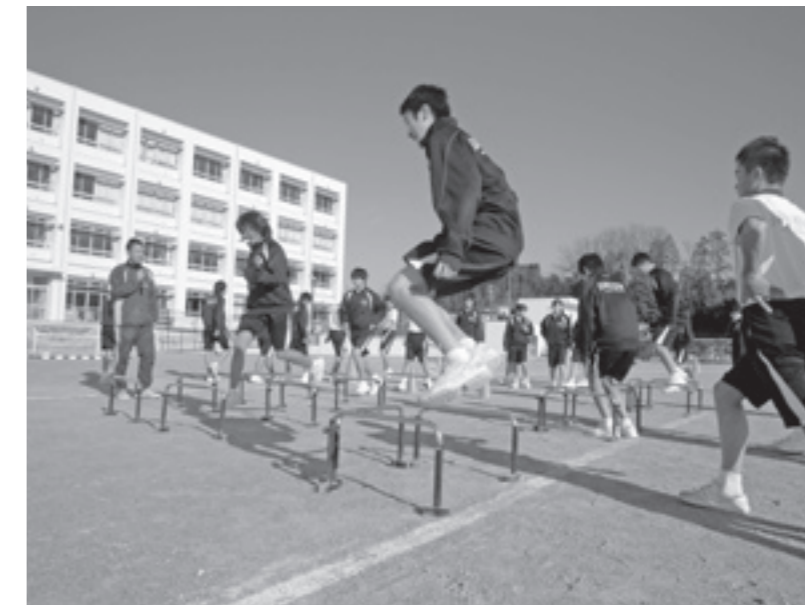
子どもの体力向上推進事業