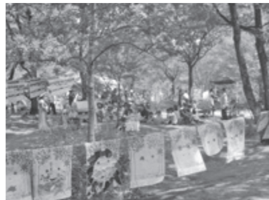
とよたデカスプロジェクト