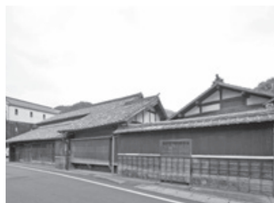
旧鈴木家住宅(重要文化財)