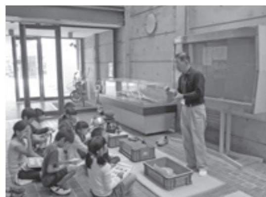
スクールサポート事業