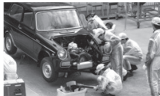
クルマづくり究めるプロジェクト