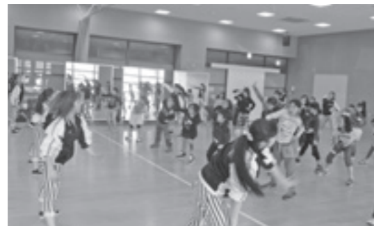
大学と連携したキッズダンス教室