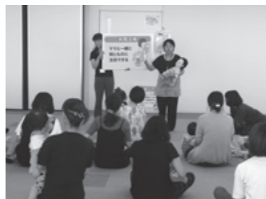
ふれあい子育て教室