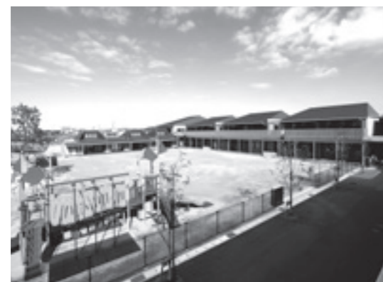
こども園の様子(外観)