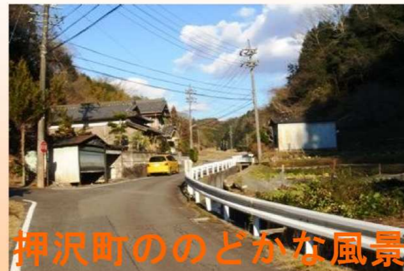
押沢町ののどかな風景