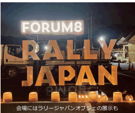
会場にはラリージャパンオブジェの展示も