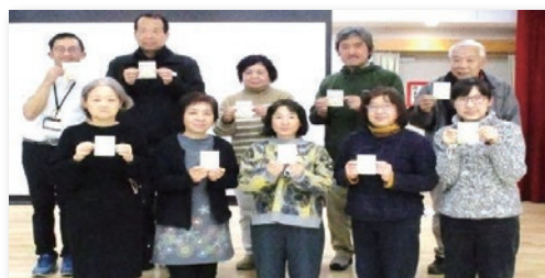
1/16 コミュニティ会議福祉部会 認知症サポーター養成講座開催