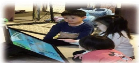
ボランティアさんの協力もあり、子どもさんと一緒に気軽に参加できました♡