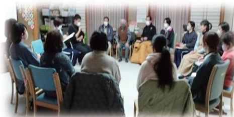
タウンミーティングで貴重なご意見を頂きました♪