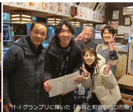
汁-1グランプリに輝いた「寿司と和食の店つたや」