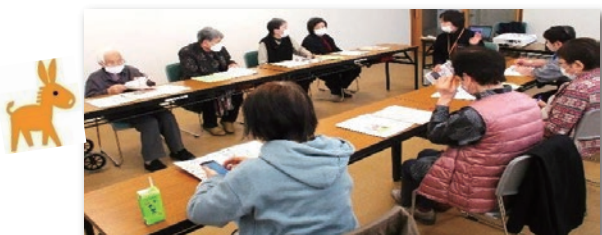
1/11 サロン DO えんがわ (稲武町) 認知症サポーターステップアップ講座開催

認知症の方や家族を支援し、誰もが暮らしやすい地域を目指すための取組みを紹介します。