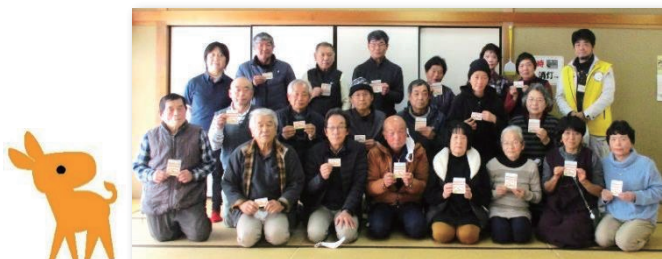
1/22 シルバー人材センター稲武支所 認知症サポーター養成講座開催