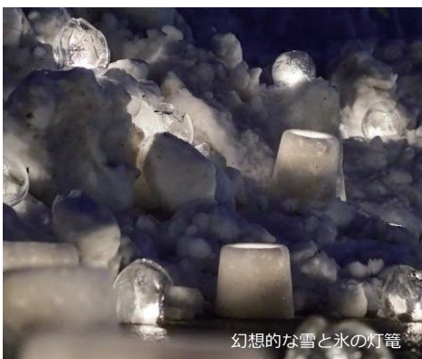
幻想的な雪と水の灯籠

なお、この事業はもともと地域予算提案事業でスタートし、当初はまちなかの賑わい創出につながればと企画、実施されたものです。NPO 稲武まちづくり協議会の皆さんをはじめ、準備から運営に関わった多くの皆さん、ありがとうございました。お疲れ様でした！