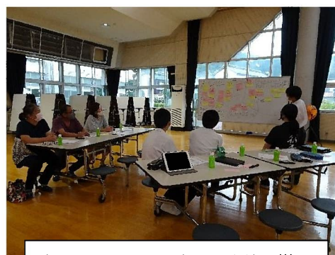
意見をまとめ、発表する生徒の様子

ボランティアさん、中学生の今後のボランティア活動の輪を広げるきっかけとなる情報交換会となりました。