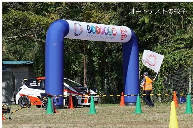
オートテストの様子