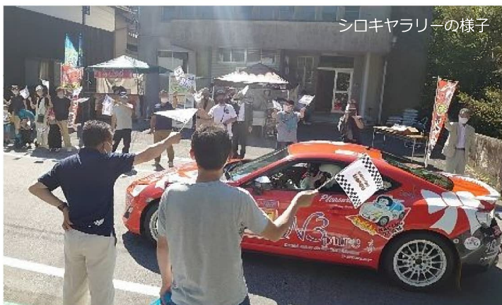
シロキヤラリーの様子