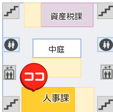
南庁舎 3F MAP

登録志願書の提出のほか、 10～15分程度の面談にて ご希望条件等の確認を行い、 登録完了といたします。