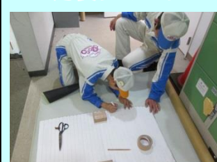
シート生地のケガキ