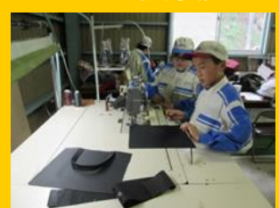
ミシンの取扱実習