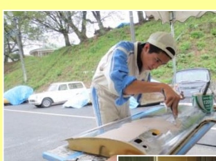
ドアパテ盛り修正