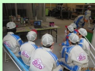
塗装のきそ使い方