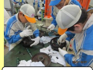
ブレーキ部品修復