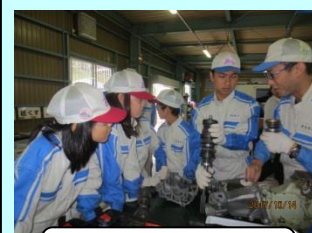
トランスミッション分解