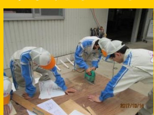
クレイモデル製作