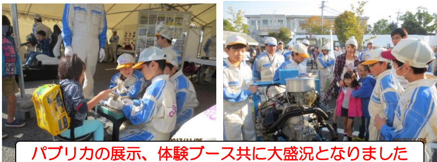
パブリカの展示、体験ブース共に大盛況となりました

11月5日(日)、スカイホール豊田でわくわくワールドが開催されました。クルマづくり究めるプロジェクトも出展し、パブリカ・エコランカーの展示、文鎮づくりや板金体験などを行いました。各ブース共に来場者が絶える事無く、親子でパブリカに乗り写真撮影をしたり、一生懸命お皿を叩いたりする来場者が見られ、大盛況の一日となりました。