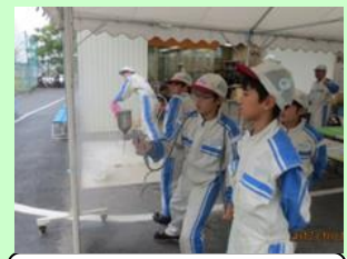
スプレーガン取扱実習