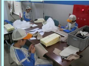
裁断パーツ寸法確認