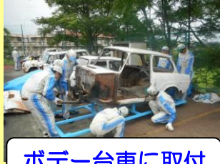
ボデー台車に取付