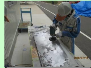
修復車塗装はがし