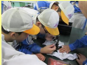
エンジン部品測定