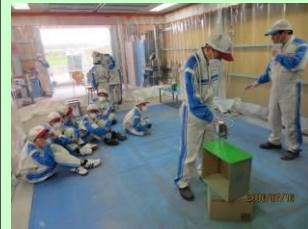
スプレー塗装実習