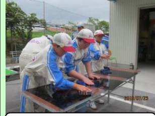
道具の使い方実習