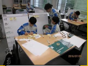
コンセプトのまとめ