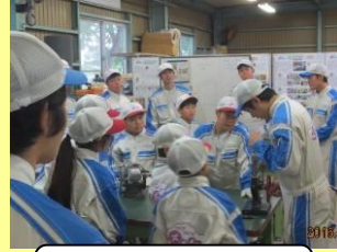
エンジン基礎教育