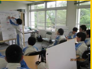
コンセプト発表会