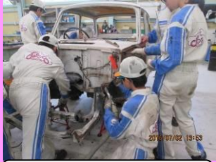
パブリカ分解実習