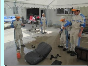
修復車シート洗浄