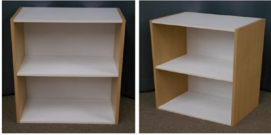
カラーボックス(2段)