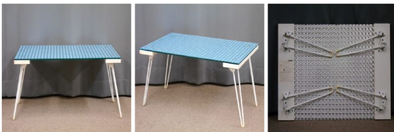
テーブル(折りたたみ式)