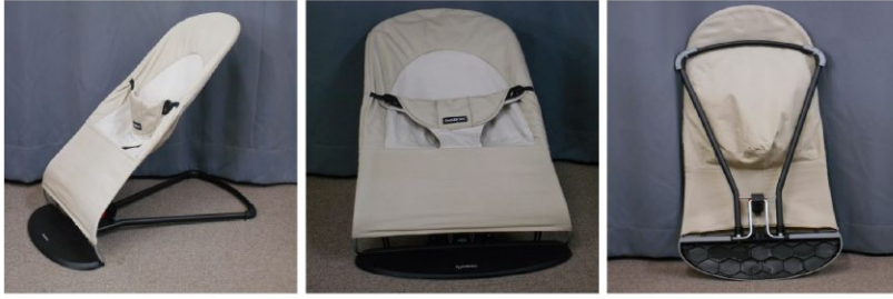
バウンサー (折りたたみ式)