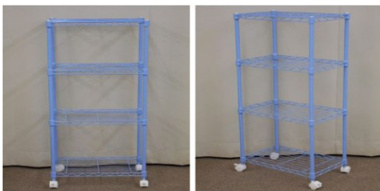
メタルラック(4段、キャスター付)