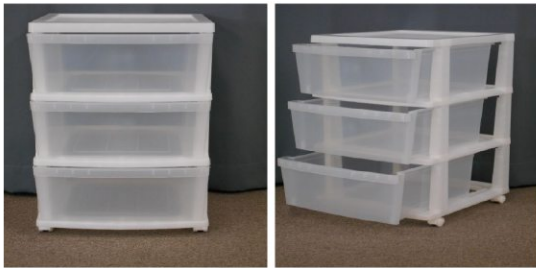
クリアケース(3段、キャスター付)