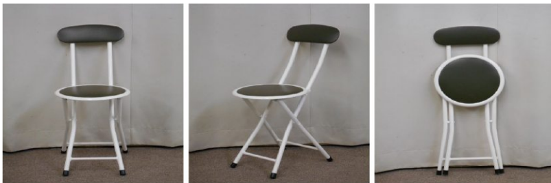
イス(折りたたみ式)