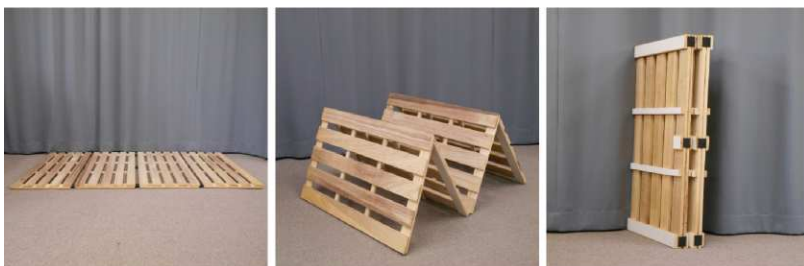
すのこ(折りたたみ式)