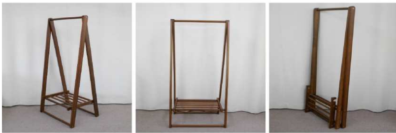
洋服掛け(折りたたみ式)