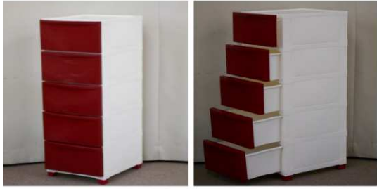
引出し式収納ケース(5段)