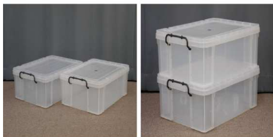
ふた付収納ケース2個セット