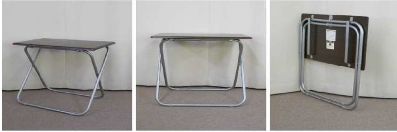
テーブル(折りたたみ式)