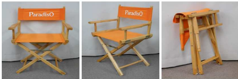
イス(折りたたみ式)