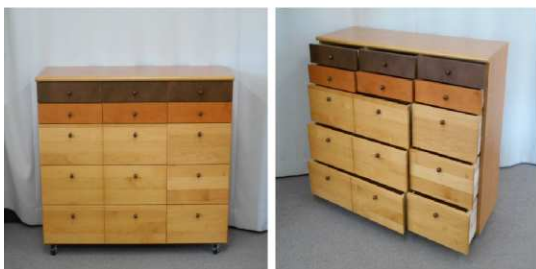
チェスト(5段、キャスター付)