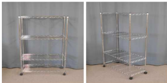
メタルラック(4段、キャスター付)