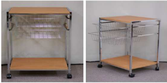
台(4段、キャスター付)