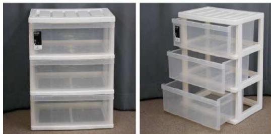
引出し式収納ケース(3段、キャスター付)