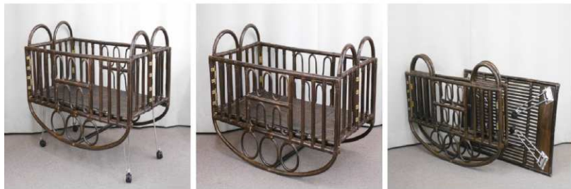
ベビーベッド(キャスター付、折りたたみ式)