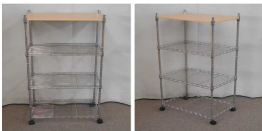
メタルラック(4段、キャスター付)