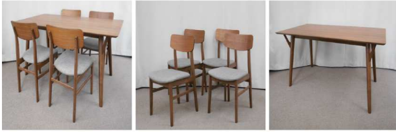
ダイニングテーブル イス4脚セット