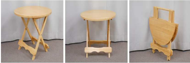
丸テーブル(折りたたみ式)