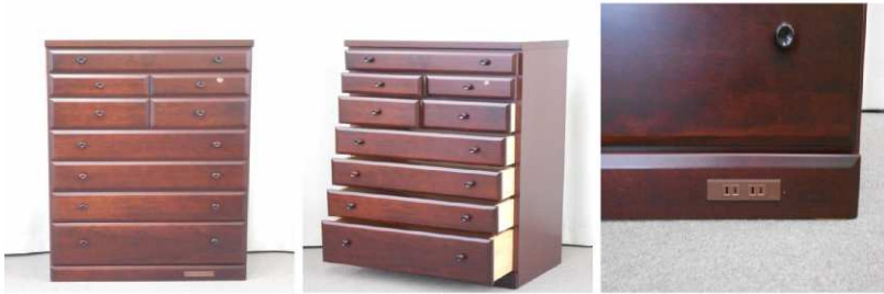
チェスト(7段、コンセント付)