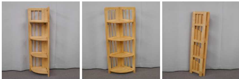
コーナー棚(4段、折りたたみ式)