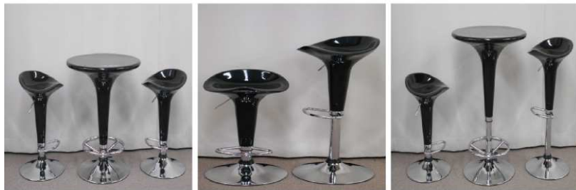
テーブル(回転、昇降式) イス2脚セット(回転、昇降式)