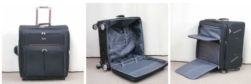
スーツケース(キャスター付)