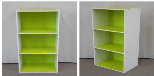
カラーボックス(3段)