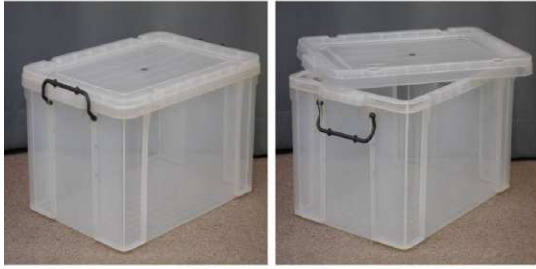
ふた付収納ケース