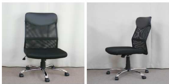
イス(回転式、キャスター付)