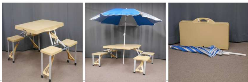
レジャーテーブル (折りたたみ式)