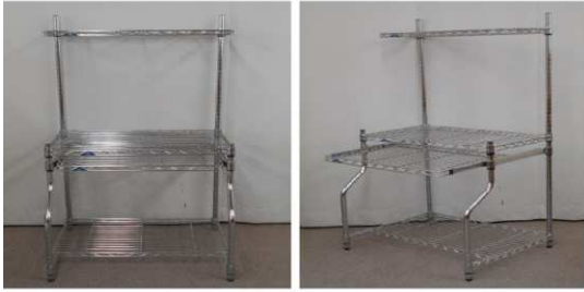
メタルラック(パソコンデスク)