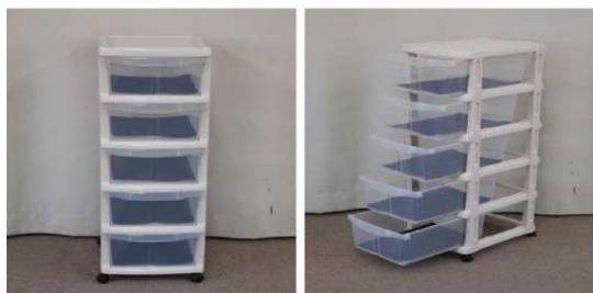
クリアケース(5段、キャスター付)