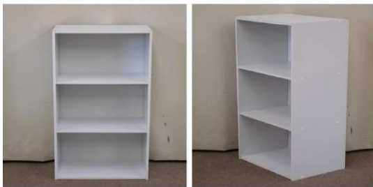
カラーボックス(3段)