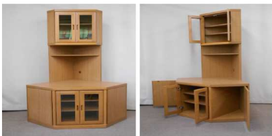
コーナーキャビネット