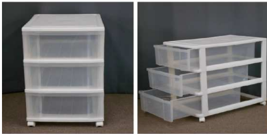
引出し式収納ケース(3段、キャスター付)