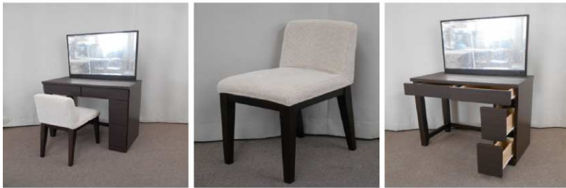
ドレッサー(コンセント付) イス