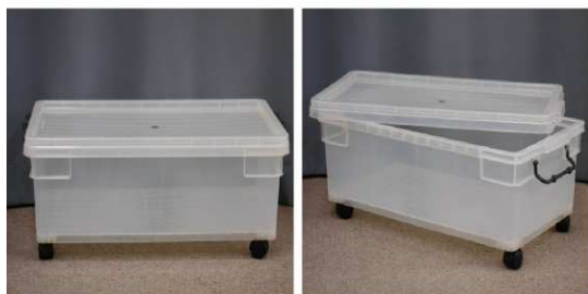
ふた付収納ケース (キャスター付)