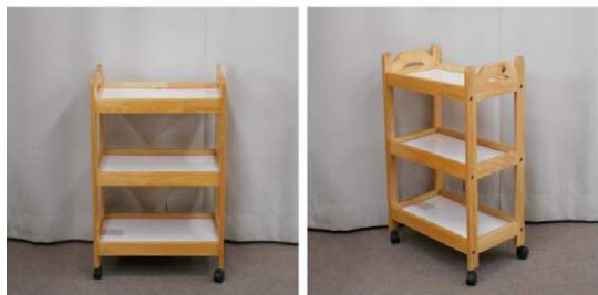
ワゴン(キャスター付)