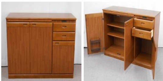
キッチンボード(コンセント、キャスター付)