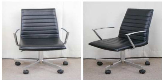
イス(回転式、キャスター付)