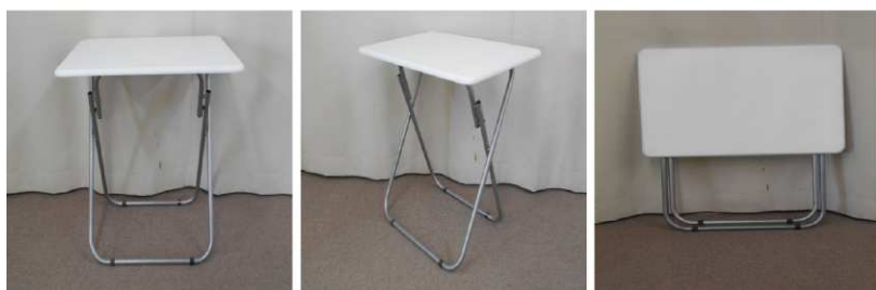
テーブル(折りたたみ式)