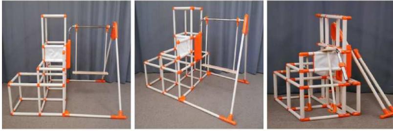
ジャングルジム(折りたたみ式)