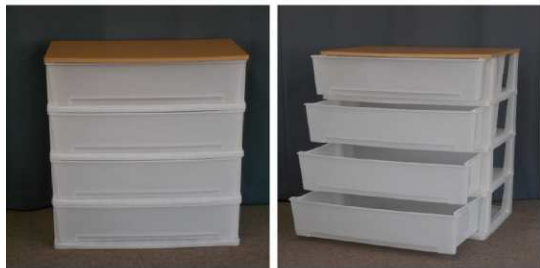
クリアケース(4段、 キャスター付)