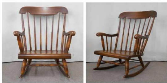
ロッキングチェア