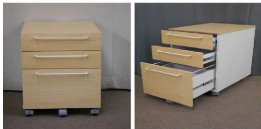
引出し棚(3段、 キャスター付)