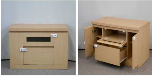
テレビ台(キャスター付)