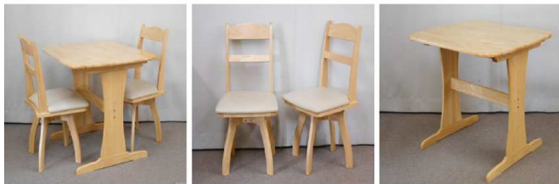
テーブル イス2脚セット (回転式)