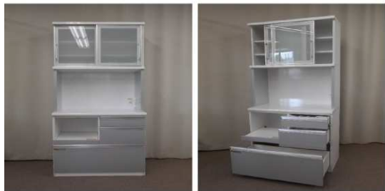
キッチンボード(コンセント付)