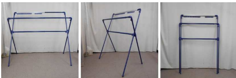
ふとん干し(折りたたみ式)