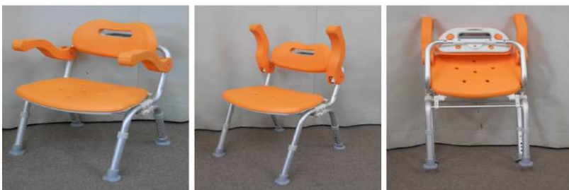
風呂用イス(折りたたみ式)