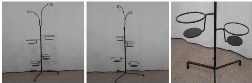
フラワースタンド