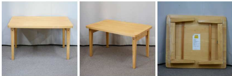
テーブル(折りたたみ式)