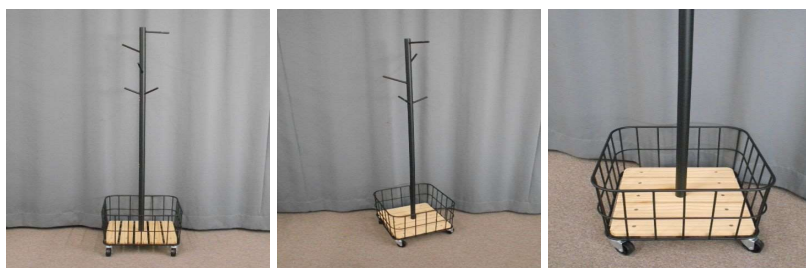
ポールハンガー(キャスター付)