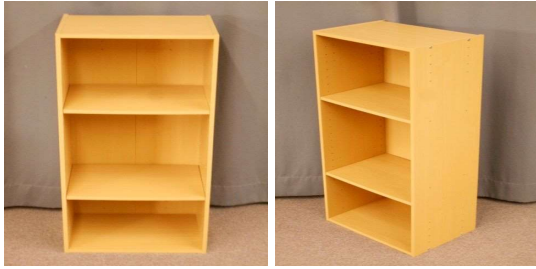
カラーボックス(3段)