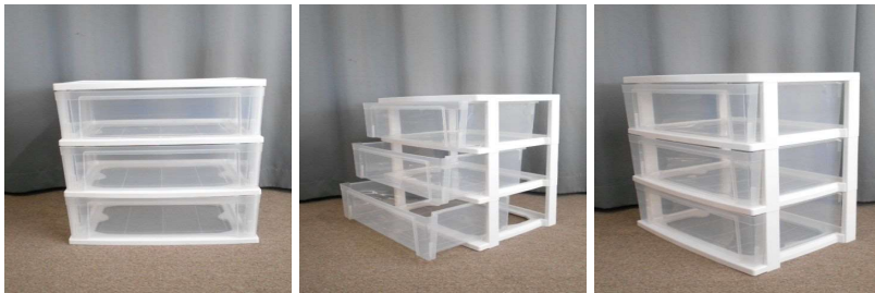
引出し式収納ケース(3段)