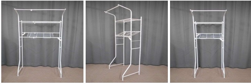
洗濯機用ラック(2段)