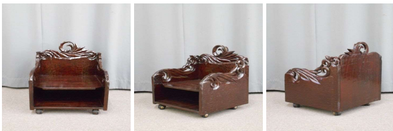
台(2段、キャスター付)