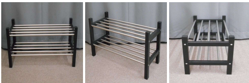
シューズラック(2 段)