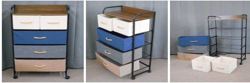
チェスト(4段、布製、キャスター付)