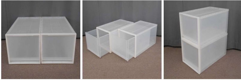
引出し式収納ケース2個セット