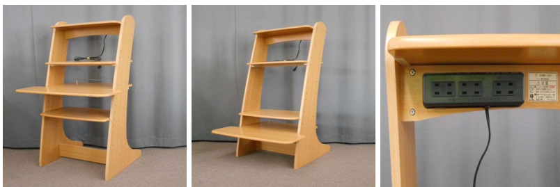
パソコンデスク(コンセント付)