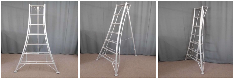
脚立(6段、折りたたみ式)