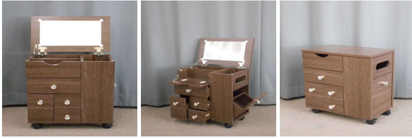
ドレッサー(キャスター付)