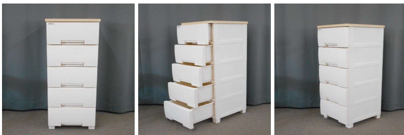
引出し式収納ケース(5段)