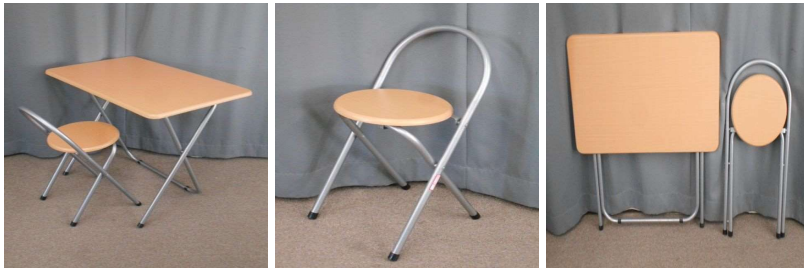
テーブル(折りたたみ式)