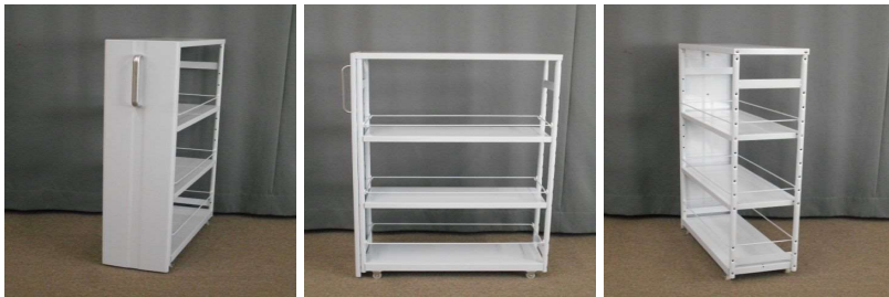
棚(4段、キャスター付)