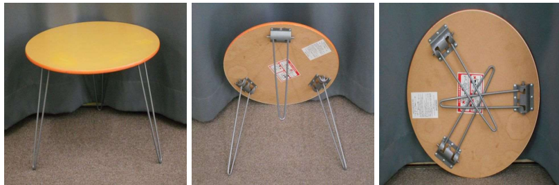
ローテーブル(折りたたみ式)