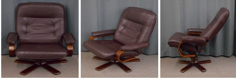
イス(回転、リクライニング式)