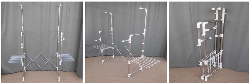
物干し(キャスター付、折りたたみ式)