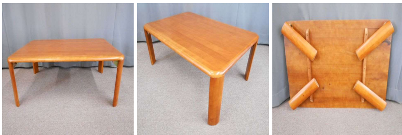
ローテーブル(折りたたみ式)