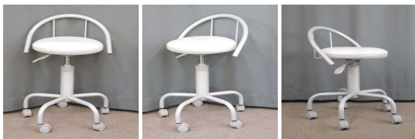
イス(キャスター付)