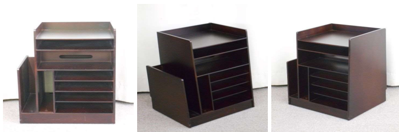
物入れ(7段、キャスター付)