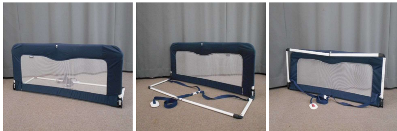
ベッドガード(折りたたみ式)