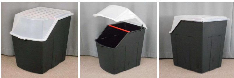
ふた付収納ケース (キャスター付)