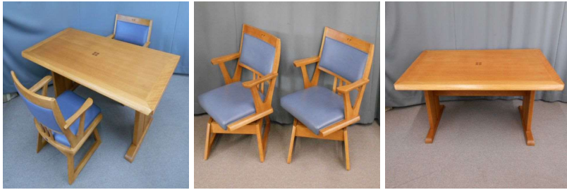
ダイニングテーブル