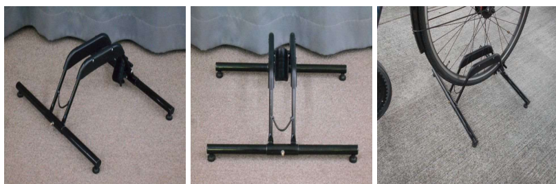
自転車のスタンド